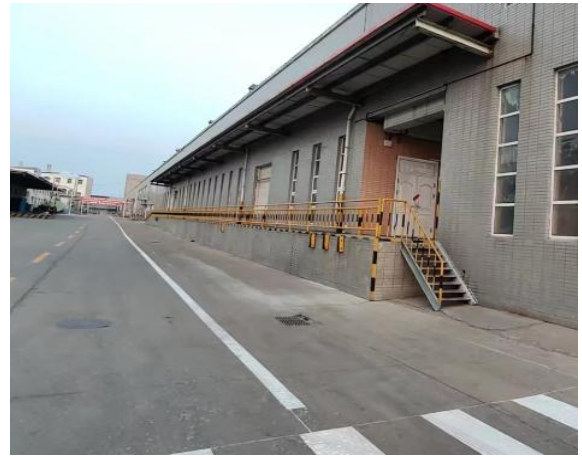
图 2-6 项目北侧