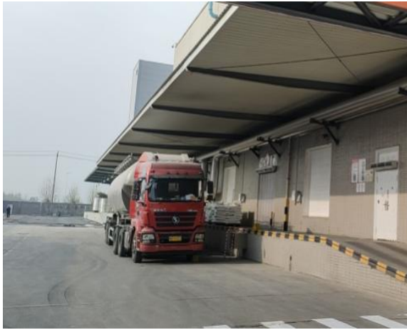
图 2-3 项目东侧