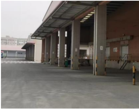
图 2-5 项目西侧