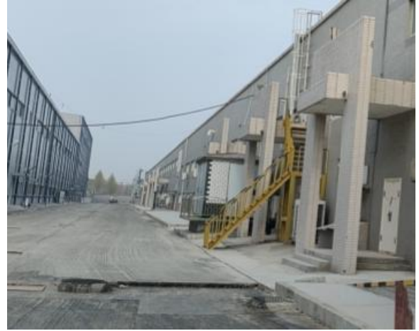
图 2-4 项目南侧